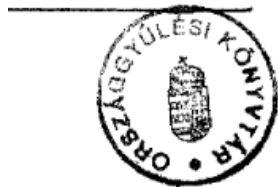
Az Országgyűlési Könyvtár hivatalos pecsétje