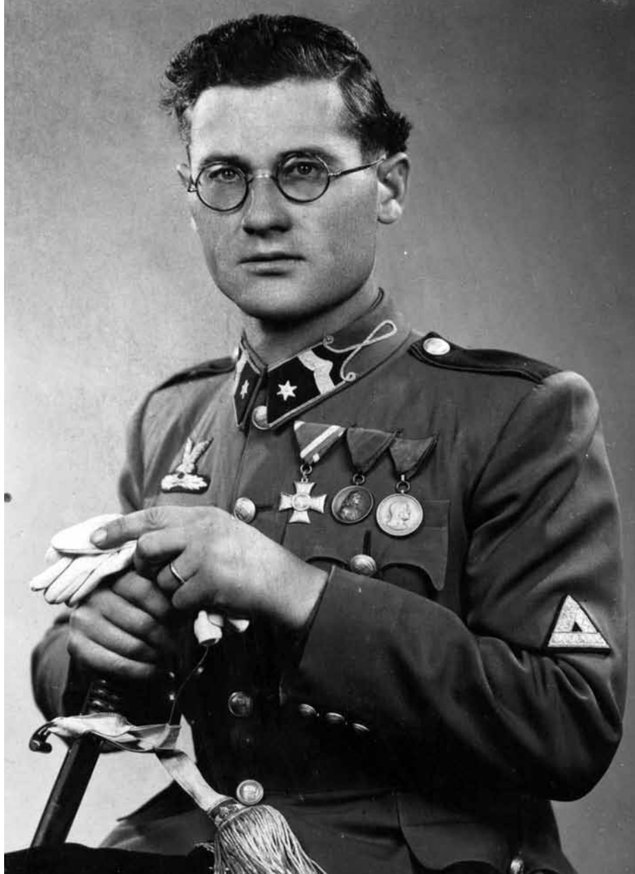
Továbbszolgáló határ vadász őrmester, 1941

A m. kir. I. Gyorshadtest létszáma és felszereltsége miatt nem lehetett döntő hatással a hadműveletek alakulására. Alakulatai – kiképzési hiányosságaik, haditapasztalatokban való járatlanságuk, valamint szervezési és felszereltségbeli hiányok ellenére – teljesítették a részükre kitzűzött feladatokat.